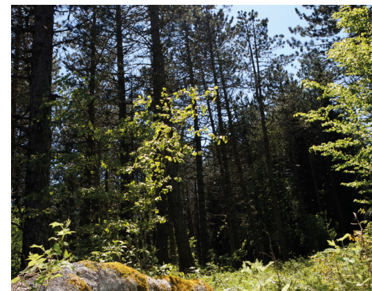
C'est à partir du 19ème siècle qu'une politique visant à la reconstitution de la forêt lozérienne est mise en œuvre après des siècles de déboisement.

Mais celui qui risque de tout changer au cours des 20 ou 30 prochaines années, sera sans conteste l'enjeu climatique. En effet, la forêt lozérienne connaît habituellement des conditions climatiques très marquées : hivers longs et froids, étés secs, vents fréquents... des conditions qui ont d'ailleurs, en son temps, permis au Pin noir d'Autriche - le mieux adapté pour les sols pauvres - d'être importé pour de nombreux reboisements de restauration des terrains. Mais les modifications climatiques ont rebattu les cartes