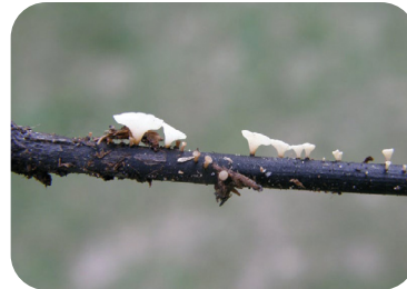
Chalarose du frêne

Des feuilles qui flétrissent, des tiges qui se nécrosent et des branches desséchées, ces signes marquent souvent la présence de parasites, micro-organismes ou de champignons pathogènes.