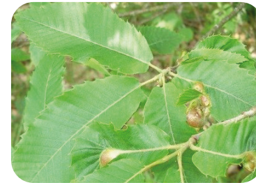
Cynips du châtaignier